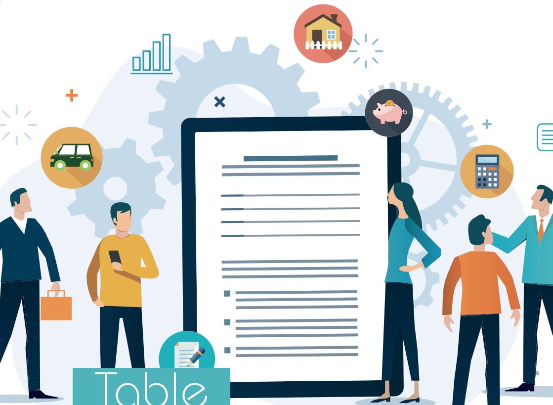
Table de concordance

Livre 9, Titre 1 er Les sûretés personnelles