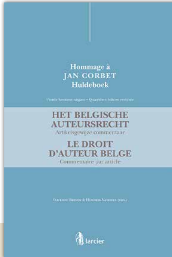
Huldeboek Jan Corbet: HET BELGISCHE AUTEURSRECHT. Artikelsgewijze commentaar / LE DROIT D'AUTEUR BELGE. Commentaire par article (Fabienne Brison & Hendrik Vanhees (eds.)) Larcier • hardcover • 1338 p.

In al die jaren hebben Hendrik en ik eigenlijk veel goede reacties op het boek ontvangen en mogen we nu toch wel zeggen dat het een soort referentiewerk in België is geworden. Daar zijn we best fier op.