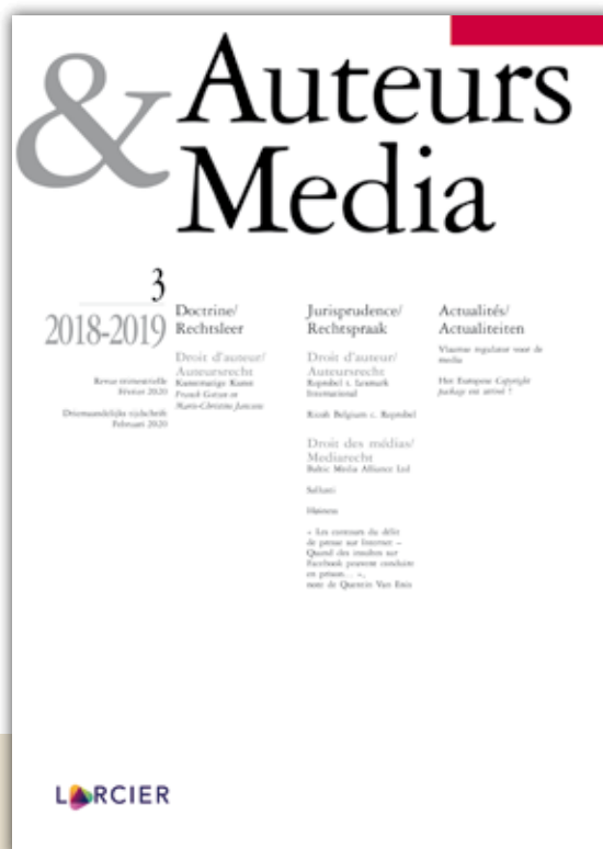
Auteurs & Media nummer 2018-2019/3.

Hoe beoordeelt u de richtlijn in zijn geheel? Goed of slecht?