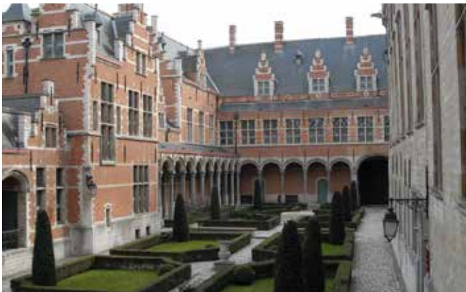
Hof Van Savoye, ook wel Paleis van Margaretha van Oostenrijk genoemd: zetel van de Grote Raad van Mechelen (1616-1795), en huidig gerechtshof te Mechelen

leren over de rechtsstaat, om dan terug vooruit te kijken nu de rechtsstaat meer dan voorheen onder druk staat en in vraag wordt gesteld.